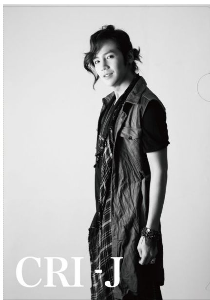
キャンペーンプレゼント