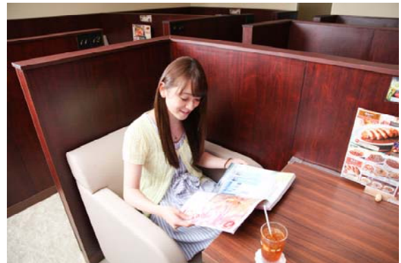
オープンシート(8ブース) 会員登録不要、カフェのようにご利用いただけます。

※どちらのお席でも、コミック、雑誌、ドリンクバー、ソフトクリームはご利用いただけます。Free Wi-Fi完備。