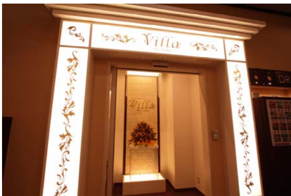
セキュリティーゲート イメージ

共有スペースとセキュリティーゲートで分けられた女性専用エリアは白を基調とした明るく清潔な空間です。今までのインターネットカフェのイメージを払拭する「女性だけの安心空間」をご用意しました。待ち合わせ前のメイク直しや時間調整にご活用いただけます。また、読みたかったマンガを思いっきり読む、観たかった映画や動画を思いっきり観る、など周りを気にせずに自分だけの時間をお過ごしいただけます。